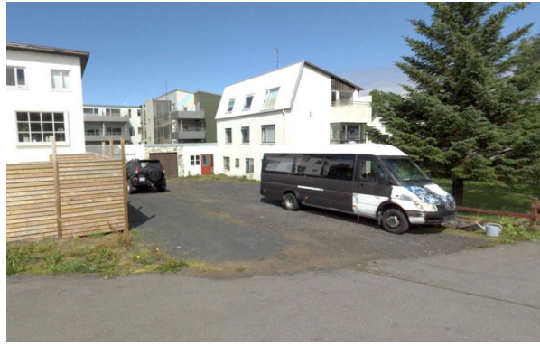
Götumynd af Sigluvogi 12 ásamt innkeyrslu 14.