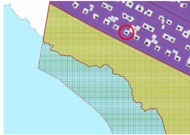
Skerjafjörður-Ægissíða - Strandssvæði