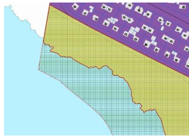
Skerjafjörður-Ægissíða - Strandssvæði