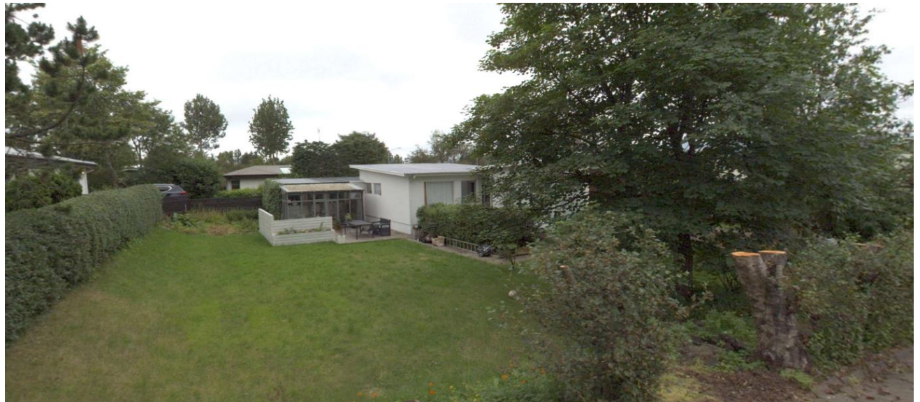
Götumynd tekin af ja.is, horft inn í garð og á bakhlið hússins