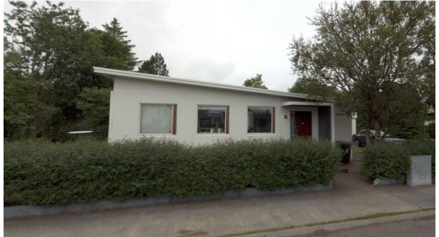
Götumynd tekin af ja.is, framhlið