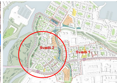
Þróunar- og uppbyggingarsvæði Ellidaárvog/Ártúnshöfða - svæði 2