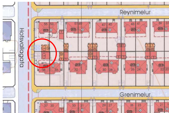
Hluti gildandi deiliskipulags