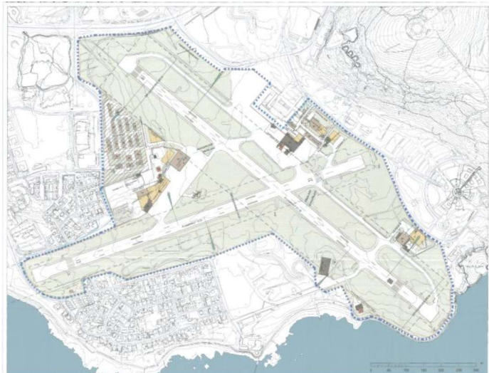
Deiliskipulag Reykjavíkurflogvallar frá 2016