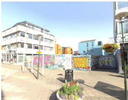
Núverandi götumynd Laugavegs

Á embættisafgreiðslufundi skipulagsfulltrúa 6. júní 2024 var lögð fram fyrirspurn Pálmars Kristmundssonar, dags. 17. maí 2024, ásamt greinargerð, dags. 17. maí 2024, um breytingu á deiliskipulagi reits 1.174.0, Landsbankareits vegna lóðarinnar nr. 73 við Laugaveg sem felst í að heimilt verði að fjölga íbúðum hússins um eina og auka byggingarmagn lítillaga, samkvæmt uppdr. PK arkitekta, dags. 2. maí 2024. Fyrirspurninni var vísað til umsagnar verkefnastjóra.