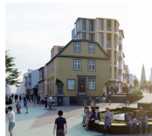
Fyrirspurn nr. 2