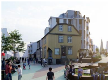
Fyrirspurn nr. 1