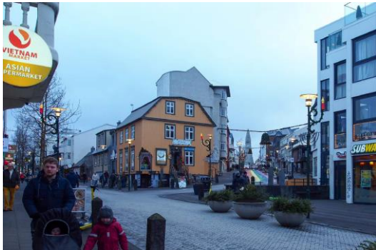
Götumynd júlí 2022