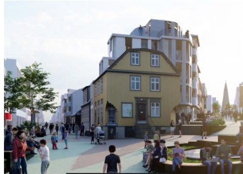
Mynd með fyrirspurn