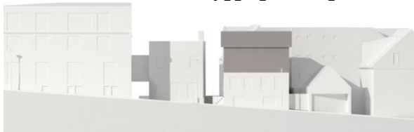
Götumynd skv. núgildandi deiliskipulagi.

Óskað er eftir að stækka byggingarreit og hækka uppbyggingu á baklóð, sbr. teikningar.