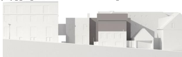
Götumynd skv. tillögu í erindi.