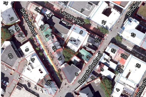
Loftmynd af Bergstaðastræti 2 og nágrenni

Húsið að Bergstaðastræti 2 var byggt 1897 en viðbygging 1908. Það er í dag skráð sem iðnaðarhús.