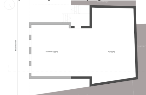
Stækkaður byggingarreitur, í erindi, sýndur í grunnmynd