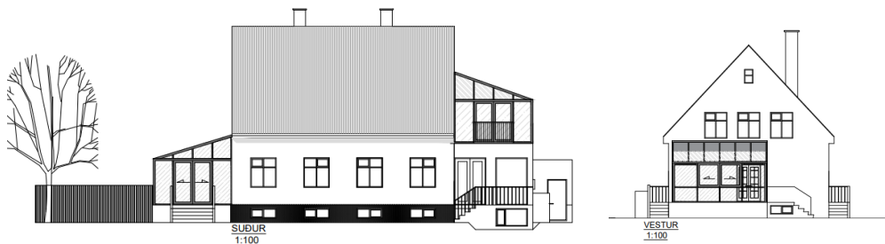
Innsendar teikningar dagsett 24.11.2023

Óskað er eftir afstöðu skipulagsfulltrúa þar sem sótt er um leyfi til að breyta erindi USK23070140 með því að byggja svalaskýli yfir svalir á 1. hæð við vesturgagl í húsi nr. 31 við Rafstöðvarveg samkvæmt tillögu.