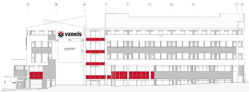
Tillaga að skiltum á vesturgafli Ofanleitis 2

Spurt er um breytingu á deiliskipulagi sem myndi heimila rúmlega 42 m 2 skilti á vesturgafli hússins, sjá mynd.