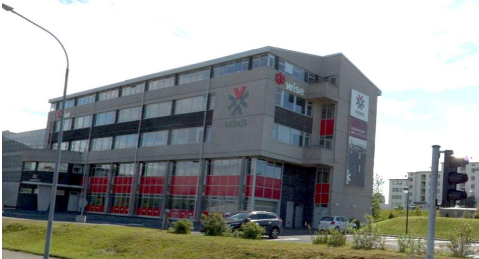
Dúkskilti sem var áður á byggingunni

Vísað er í að áður var dúkskilti á þessum stað sem hefur verið til vandræða vegna veðurálags.