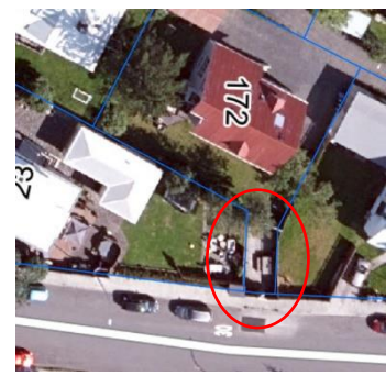
Loftmynd tekin úr borgarvefsjá