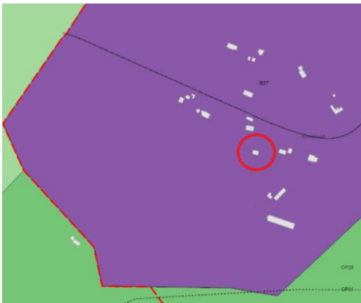
Hluti aðalskipulags 2040.

Lagt fram erindi frá afgreiðslufundi byggingarfulltrúa frá 7. maí 2024 þar sem sótt er um leyfi til að byggja bílgeymslu, mhl. 02 úr timbri á lóð nr. 2A við Lykkju á Kjalarnesi.