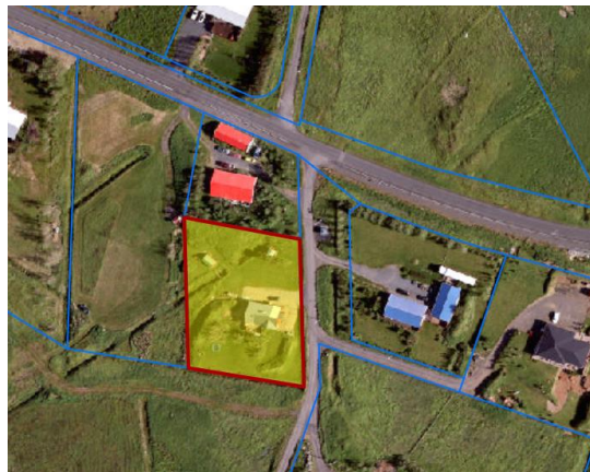
Loftmynd, dags. 20.07.2022.