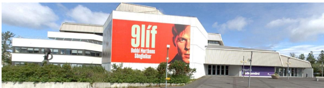
Núverandi skilti við Listabraut 3