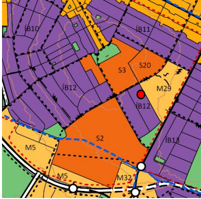
Aðalskipulag Reykjavíkur 2040.

Á embættisafgreiðslufundi skipulagsfulltrúa 29. febrúar 2024 var lagt fram erindi frá afgreiðslufundi byggingarfulltrúa frá 27. febrúar 2024 þar sem sótt er um leyfi að bæta við kvist á norðurhlíð einbýlishús á lóð nr.25 Leifsgötu.