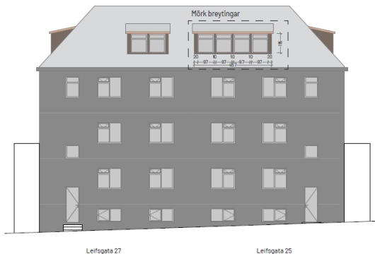
Tillaga að breytingu - útlit til norðurs. Skala arkitektar

Sótt er um leyfi að bæta við kvisti á norðurhlið einbýlishús á lóð nr. 25 Leifsgötu. Meðfylgjandi er teikning sem sýnir tillögu að kvisti.