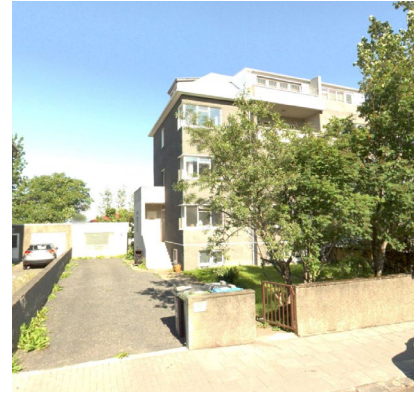
Leifsgata 25, skjáskot af ja.is 2023.