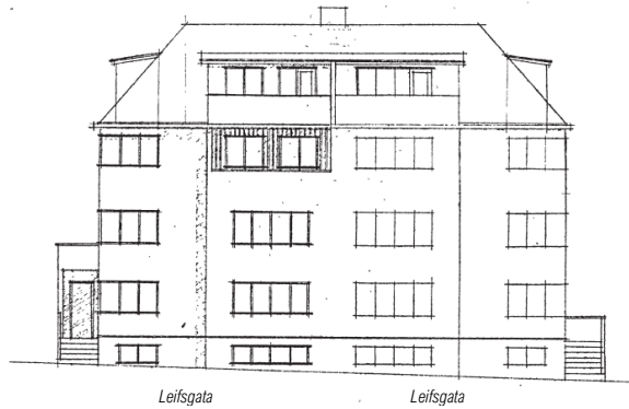
Útlit til suðurs. Breyting frá 1957.