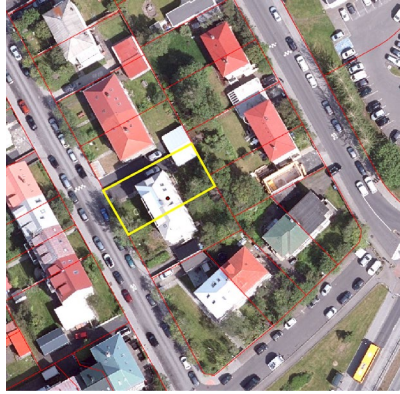
Loftmynd, Borgarvefsjá 2023.