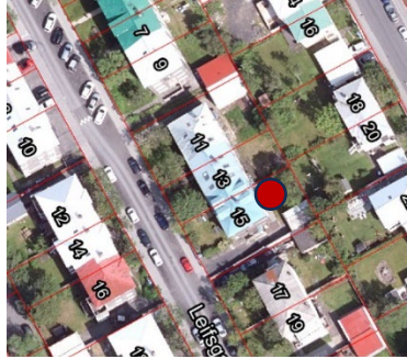
Loftmynd, Leifsgata 15