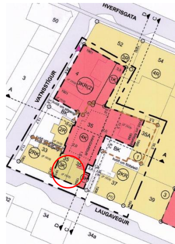
Úr breytingu á deiliskipulagi, samþykkt samþykkt 25. júní 2021