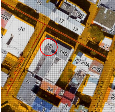
Aðalskipulag Reykjavíkur 2040

Lögð fram fyrirspurn VMT ehf., dags. 4. apríl 2023, ásamt bréfi, dags. 4. apríl 2023, um fjölgun á gistiherbergjum, án fjölgunar gesta, í húsinu á lóð nr. 18 við Laugaveg.