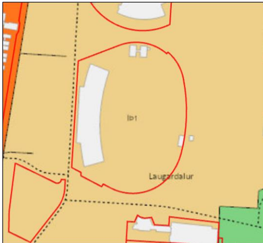
Hluti aðalskipulags Reykjavíkur 2040.

Lögð fram umsókn KSÍ ehf., dags. 9. janúar 2025 um framkvæmdaleyfi til að gera upphitaðan Hybrid knattspyrnuvöll (þjóðarleikvang) að laugardalsvelli, á lóð nr. 15 við Reykjaveg, og jafnframt að færa hann um 8 metra nær stúku að vestanverðu, samkvæmt tillögu PLAN Studio, dags. 30. september 2024.