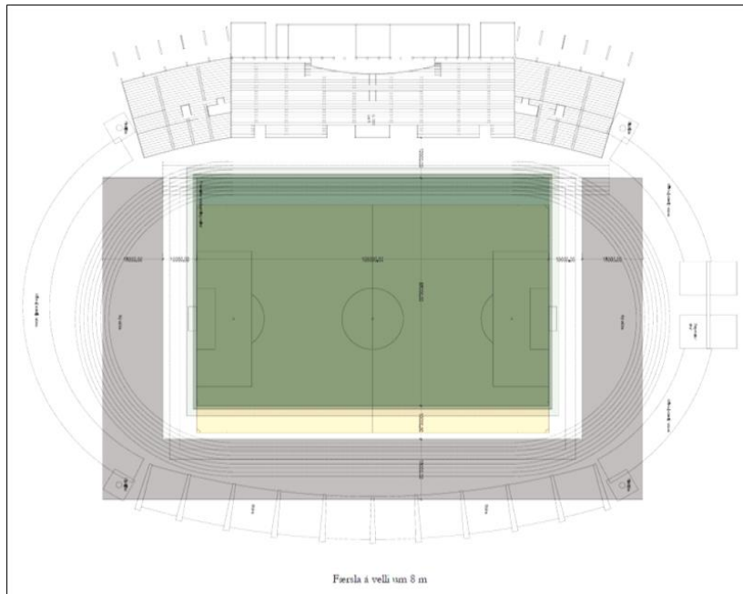
Yfirlitsmynd sem sýnir færslu grasvallar að aðalstúkunni.

Í gildi er deiliskipulag fyrir svæðið, dags. 30. janúar 1987 með síðari breytingum.