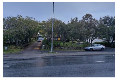
Mynd með fyrirspurn