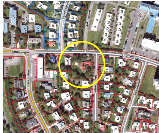
Afstöðumynd af lóð