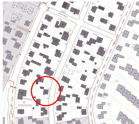
Hluti gildandi deiliskipulags