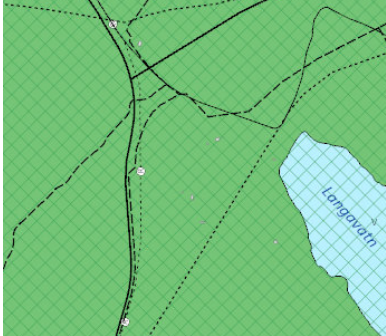
Aðalskipulag Reykjavíkur 2040 Loftmynd af svæðinu

Á embættisafgreiðslufundi skipulagsfulltrúa 04.apríl.2024 var lögð fram fyrirspurn Basalt arkitekta ehf., dags. 19. mars 2024, um gerð deiliskipulags fyrir lóð við Langavatn, samkvæmt drögum að deiliskipulagslýsingu, dags. 19. mars 2024.