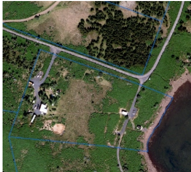
Teikning í fyrirspurn