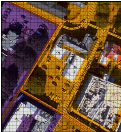
Mynd 1. Loftmynd og skipulag