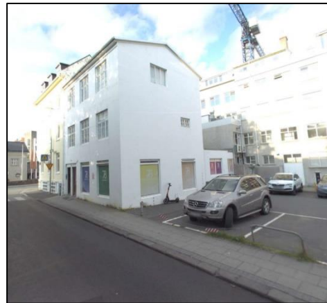
Mynd 2. Götumynd af Suðurgötu 3