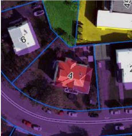
Aðalskipulag Reykjavíkur 2040