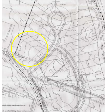
Deiliskipulag, Kletthálsi 1