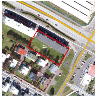
Loftmynd, borgarvefsjá 2022.