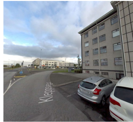
Skjáskot, ja.is 2022.

Aðalskipulag: Í Aðalskipulagi Reykjavíkur 2040 (AR2040), samþykkt í borgarstjórn Reykjavíkur þann 26. apríl 2012. Samkvæmt AR2040 er lóðin sem um ræðir á skilgreindu íbúðarsvæði ÍB22.