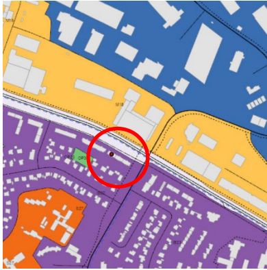
Aðalskipulag Reykjavíkur 2040.