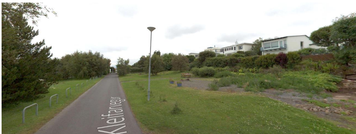
Skjáskot. Horft yfir spilduna að Kleifarveg 15. Tekið af ja.is.

Deiliskipulag/ Hverfisskipulag: Í gildi er deiliskipulagið Skipulag fyrir Langholt , samþykkt í borgarráði dags. 19. maí 1953, með síðari breytingum.