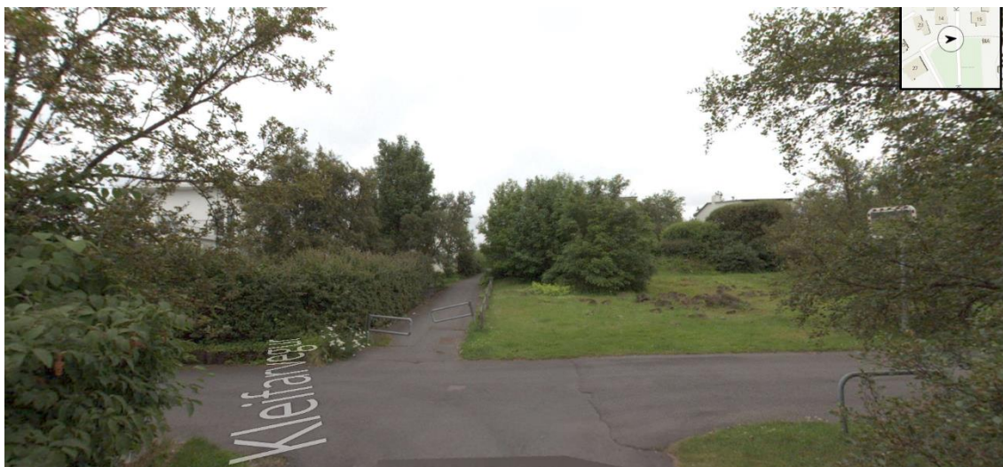
Skjaskot frá ja.is af Kleifarveg 15, göngustignum og hluta af spildunni.

Óskað er eftir afstöðu skipulagsfulltrúa um fyrirspurn varðandi stækkun lóðar við Kleifarveg 15 um u.þ.b. 20 metra til suðurs en stækkunin yrði um 400 m 2 . Spildan sem um ræðir var áður leikvöllur með sandkassa sem var fjarlægður fyrir einhverjum árum. Í dag er lóðin í órækt samkvæmt umsækjanda og grjót og möl eru inná svæðinu eftir framkvæmdir sem áttu sér stað við hliðina á. Göngustígur er á milli Kleifarvegs 15 og spildunnar.