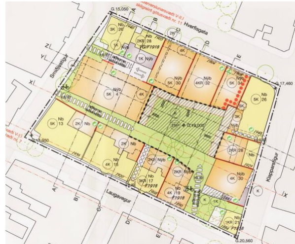
Deiliskipulag í gildi