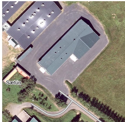
Loftmynd tekin af Borgarvefsjá