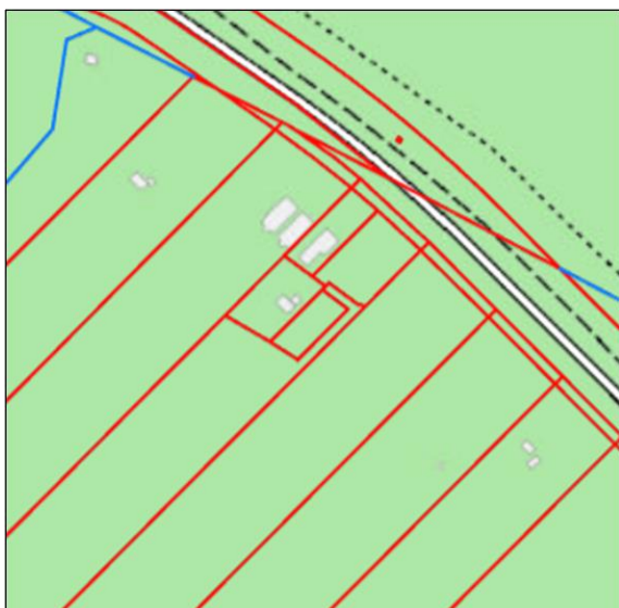
Hluti aðalskipulags Reykjavíkur 2040.

Lögð fram fyrirspurn Skurnar ehf., dags. 1. nóvember 2024, um nýtt deiliskipulag fyrir Smábýli 15 á Kjalarnesi, Sætúni II, sem felst í að auka byggingarmagn á spildunni, samkvæmt uppdrætti TAG teiknistofu, dags. 22. október 2024