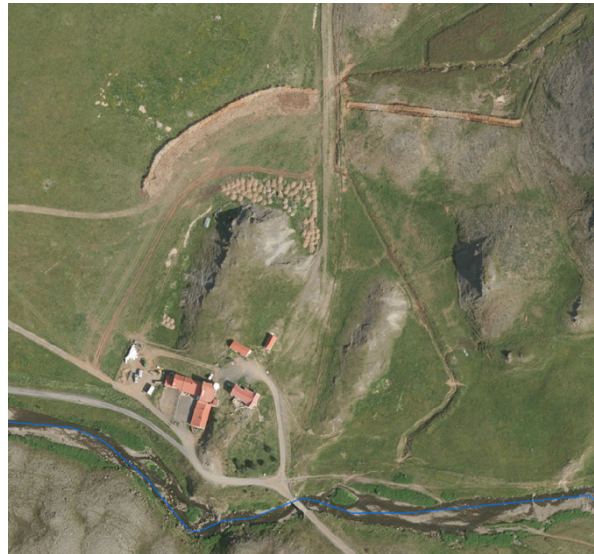
Loftmynd af svæðinu