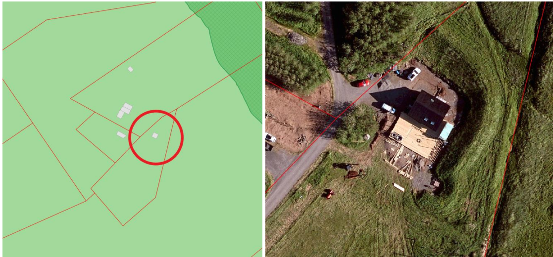
Landnotkun skv. aðalskipulagi Reykjavíkur 2040.

Lögð fram fyrirspurn Berglindar Gunnarsdóttur, dags. 21. júní 2024, um stækkun hússins að Esjulaut á Kjalarnesi og koma þar fyrir bílageymslu, fóðurgeymslu og geymslu, samkvæmt uppdráttum, ódags.