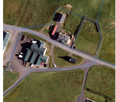
Loftmynd af svæðinu