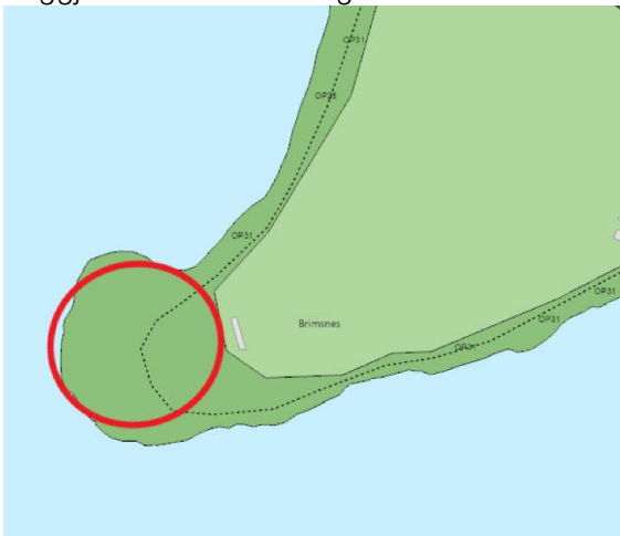
Hluti aðalskipulags Reykjavíkur 2040.

Á embættisafgreiðslufundi skipulagsfulltrúa 25. júlí 2024 var lagður fram tölvupóstur Heilbrigðiseftirlits Reykjavíkur, dags. 24. júlí 2024, þar sem óskað er eftir umsögn skipulagsfulltrúa vegna umsóknar Ræktunarsamband Flóa og Skeiða ehf. um starfsleyfi fyrir jarðborunum á tveimur borteigum á Kjalarnesi. Í umsókninni er sótt um starfsleyfi fyrir borun tveggja allt að 800 m langra borhola í leit að heitu vatni.