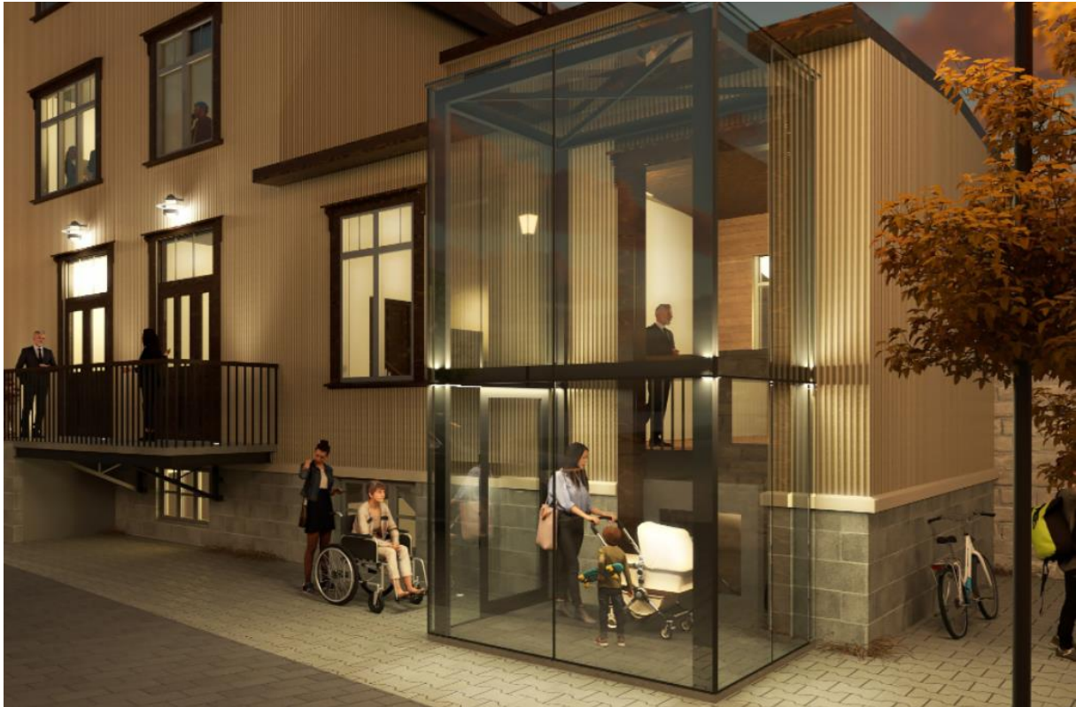
Tillaga að breytingum á Kirkjustræti 4