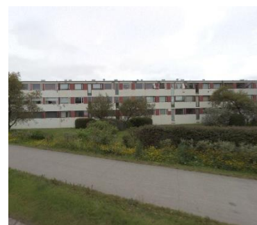
Austurhlið Kónsbakka 2-16