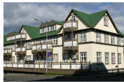
Fyrsta fjölbýlishús Íslands, Bjarnaborg