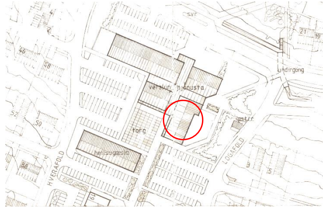
Hluti deiliskipulags, samþykkt 1. janúar 1984