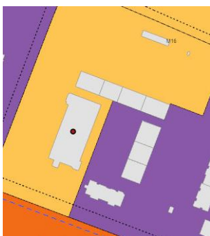
Aðalskipulag Reykjavíkur 2040. Hverfisskipulag.

Á embættisafgreiðslufundi skipulagsfulltrúa 4. júlí 2024 var lagt fram erindi frá afgreiðslufundi byggingarfulltrúa frá 2. júlí 2024 þar sem sótt er um leyfi til þess að breyta innra skipulagi og fjölga eignum með því að skipta rýmum 0104 og 0108 upp, minni verslunareiningar og vinnustofur í verslunar- og íbúðarhúsi við Hraunbæ 102A, mhl.01 á lóð nr. 102 við Hraunbæ. Erindinu var vísað til umsagnar verkefnastjóra og er nú lagt fram að nýju ásamt umsögn skipulagsfulltrúa dags. 11. júlí, 2024.