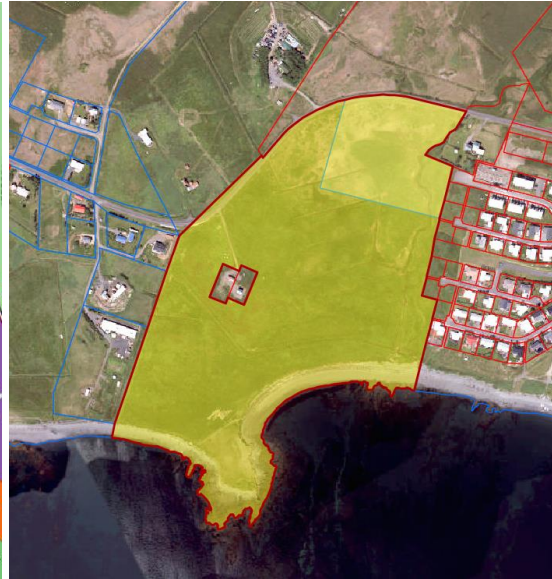
Loftmynd, dags. 20.07.2022.