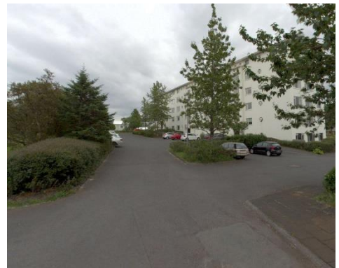
Götumynd tekin af Já.is