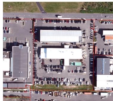
Loftmynd af svæðinu