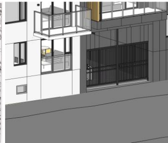
Aðalskipulag Reykjavíkur 2040 Síðasta deiliskipulagsbreyting fyrir lóð F