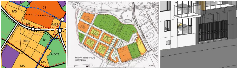
Aðalskipulag Reykjavíkur 2040 Síðasta deiliskipulagsbreyting fyrir lóð F

Lagt fram erindi frá afgreiðslufundi byggingarfulltrúa frá 28. nóvember 2023 þar sem sótt er um leyfi til að breyta útfærslu á hliði í undirgöngnum á áður samþykktu erindi í húsi nr. 1 við Haukahlíð.