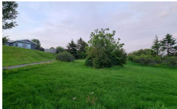
Mynd af svæði sem fyrirspurn varðar