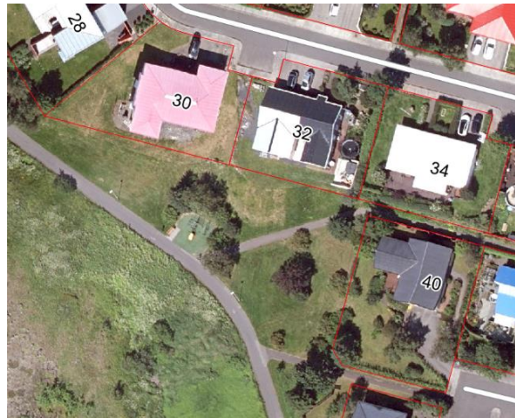
Hluti gildandi deiliskipulags fyrir Teigagerðisreit