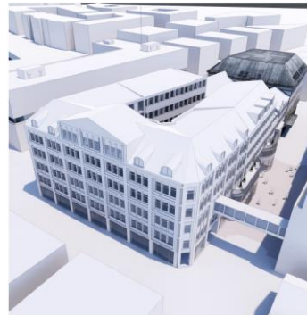
Tillaga af hækkun