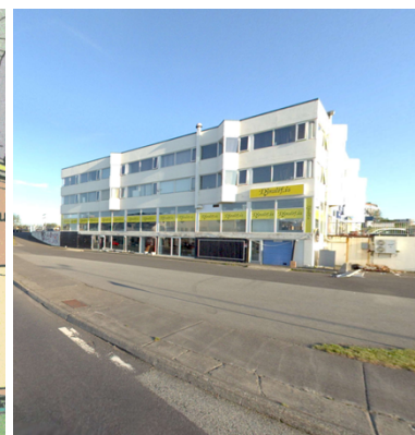
Götumynd (ágúst 2023)